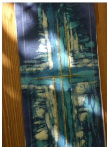
Kreuz einer Priesterstola mit Batik gestaltet

Kleidung ist auch Ausdruck . Zum Beispiel in der